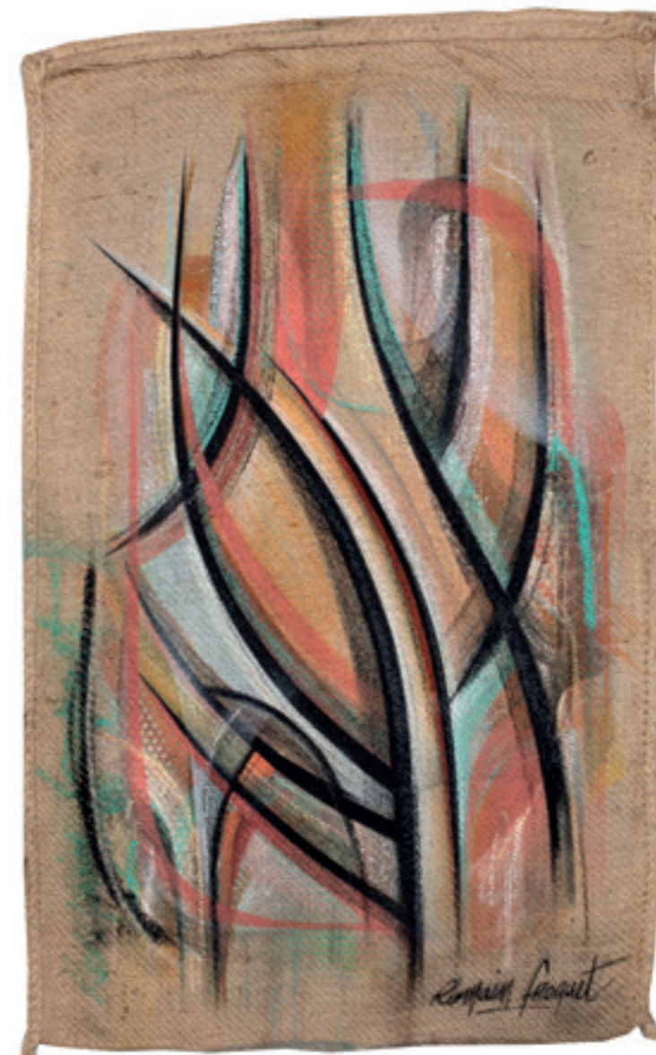
Arabica, Acrylique sur sac de jute, 75x110 cm - 2018 - 950,00 €