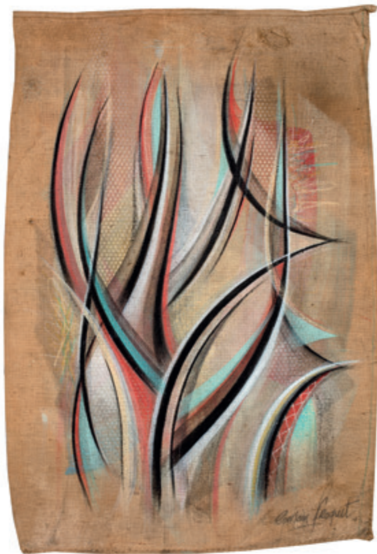
Dextrine, Acrylique sur sac de jute, 75x110 cm - 2018 - 1 050,00 € encadré sous verre