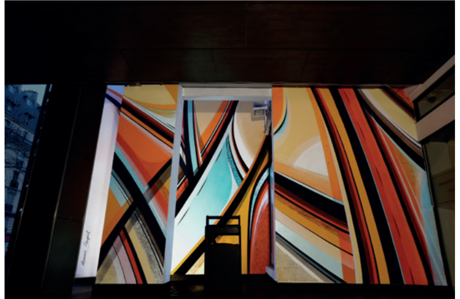
Hotel Mercure, Paris Montmartre - 2018