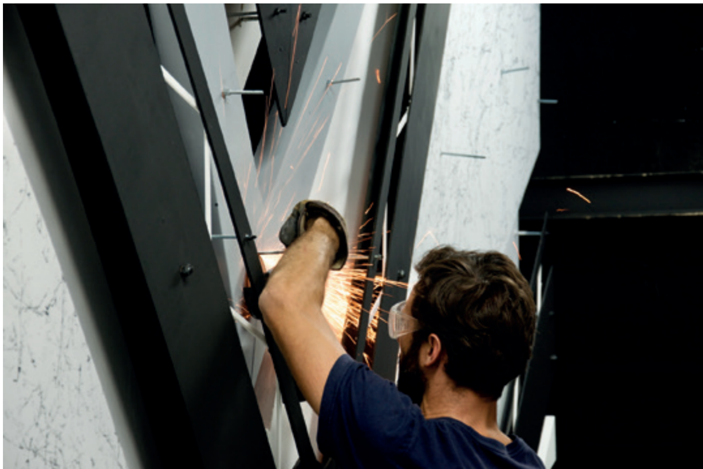
Installation, Highway WIP