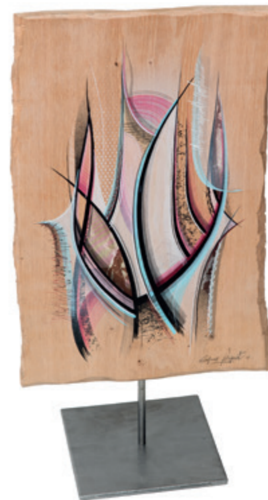
Féline, Techniques mixtes sur bois, 51x34 cm - 2018 - 750,00 € monté sur socle