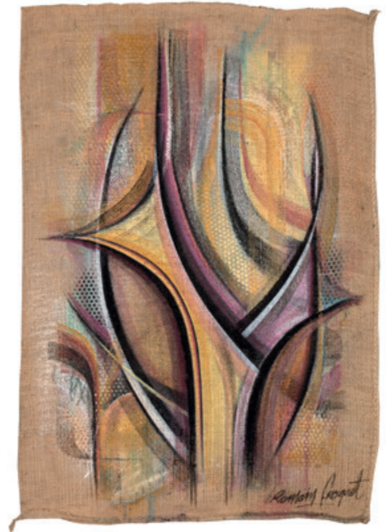
Honduras, Acrylique sur sac de jute, 73x106 cm - 2018 - 1 050,00 € encadré sous verre