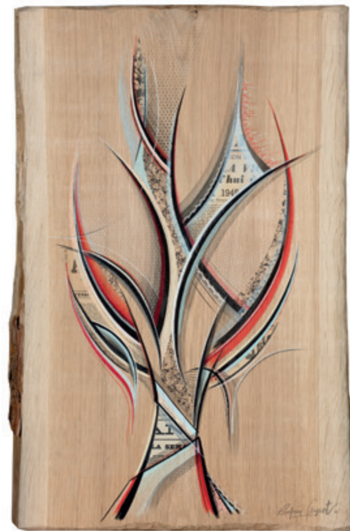
Family Tree, Techniques mixtes sur bois, 48x76 cm - 2018 - VENDU