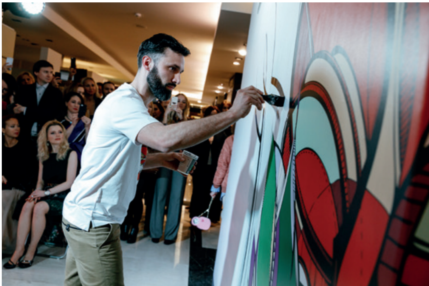
Bosco, WIP Moscou