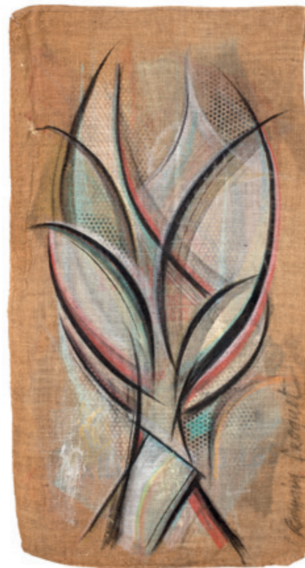
Echange, Acrylique sur sac de jute, 50x110 cm - 2018 - 850,00 €