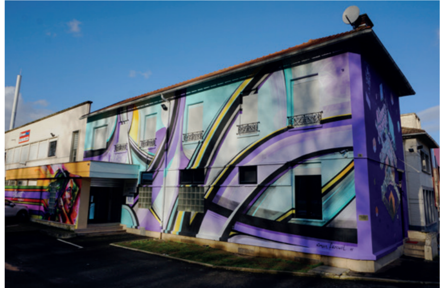
Rainbow, Stuart Magazine, Bonneuil sur Marne - 2018