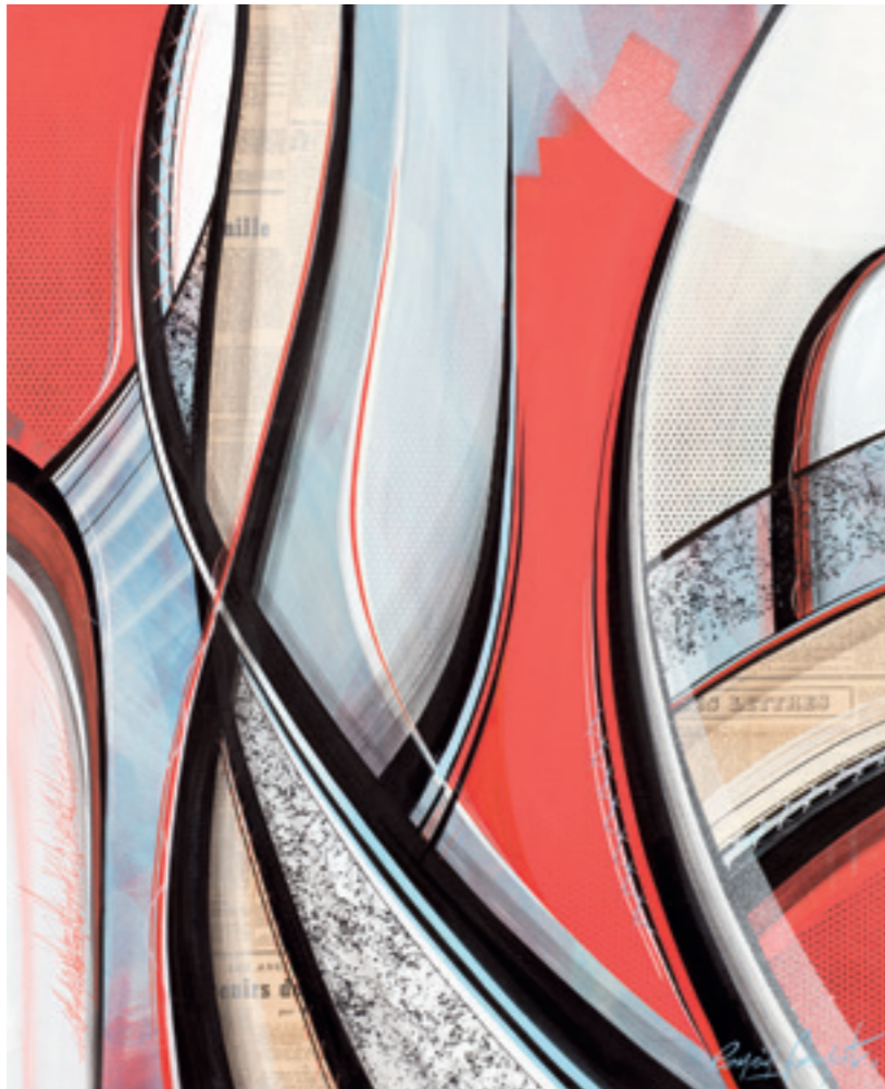
Souvenirs, Acrylique sur toile, 73x60 cm - 2018 - 1 400,00 €