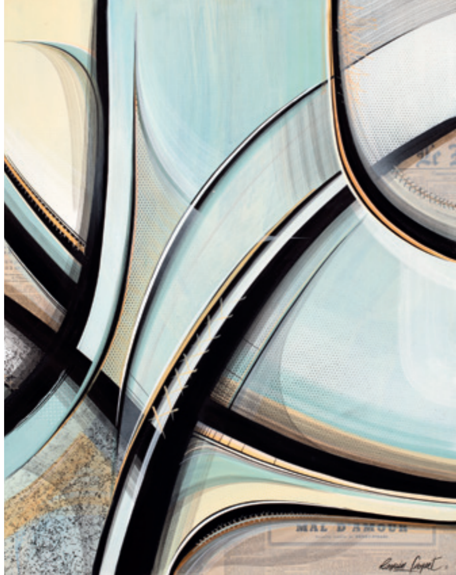
Mal d'Amour, Acrylique sur toile, 92x73 cm - 2018 - 1 800,00 €