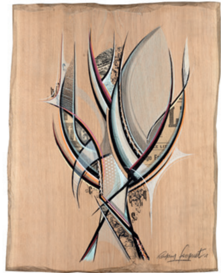
Fertile , Techniques mixtes sur bois, 33x43 cm - 2018 - 650,00 €