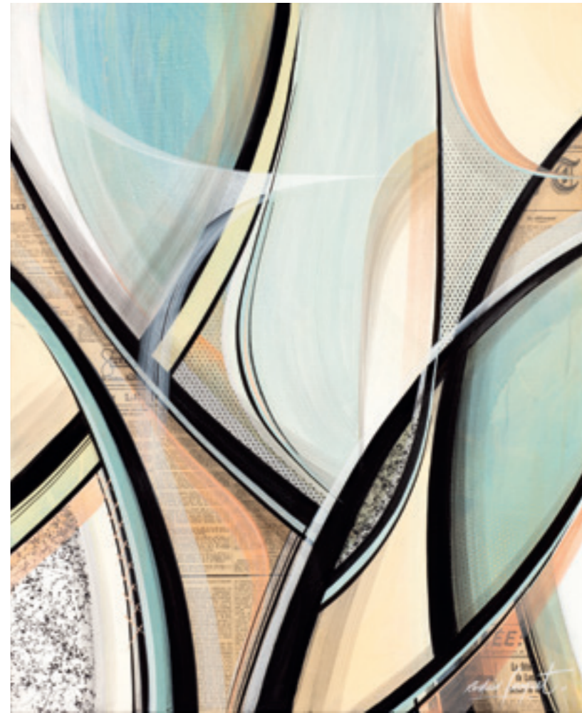
Just like me, Acrylique sur toile, 73x60 cm - 2018 - 1 400,00 €