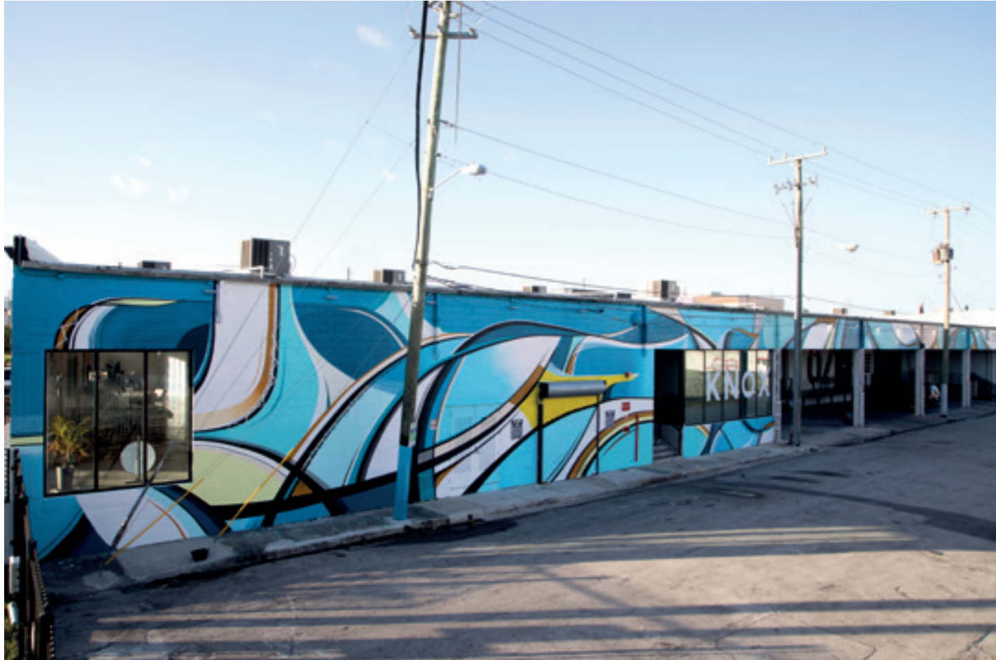
Crossroadswall, Wynwood Miami - 2017