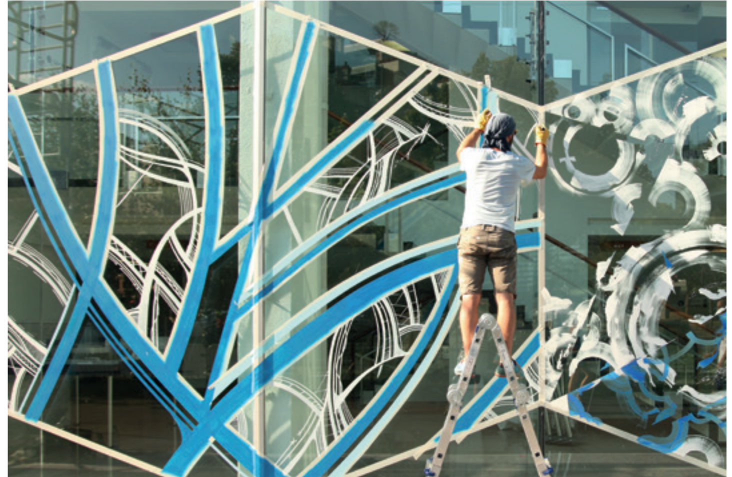
Radiographik, Maison de la Radio Paris - 2016