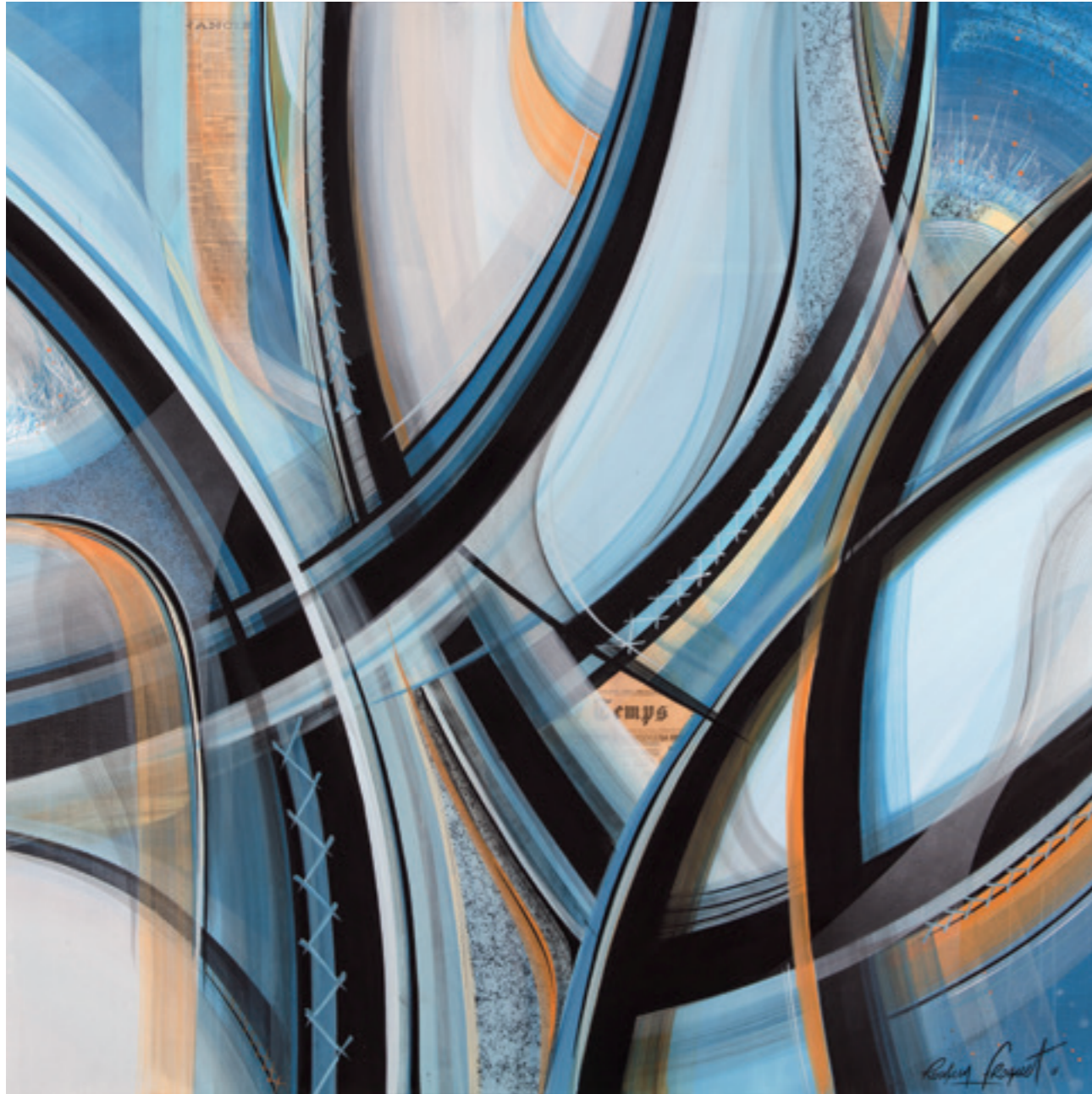
Above the Line, Acrylique sur toile, 180x180 cm - 2018 - 8 000,00 €