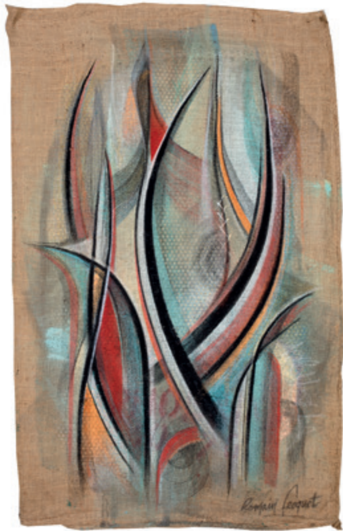
Ethiopia, Acrylique sur sac de jute, 75x110 cm - 2018 - 950,00 €