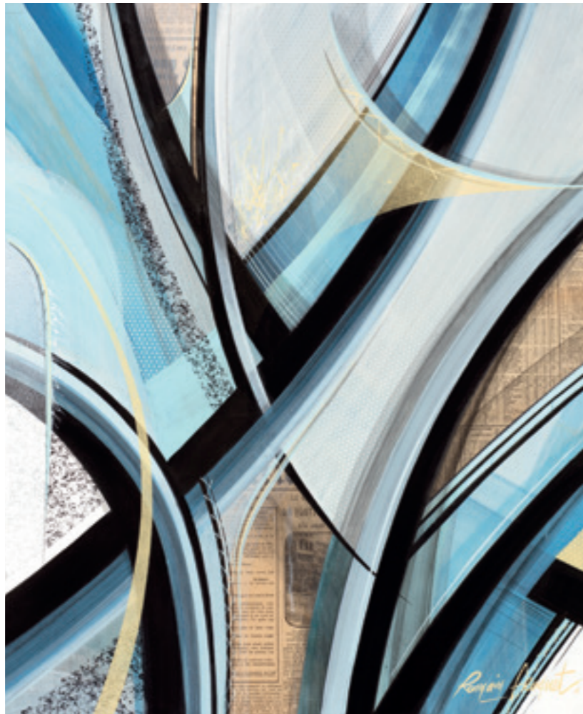
I hope it's gonna rain, Acrylique sur toile, 73x60 cm - 2018 - VENDU