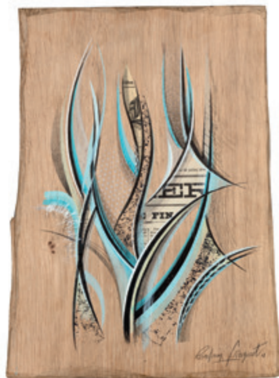
Climb, Techniques mixtes sur bois, 25x38 cm - 2018 - 550,00 €