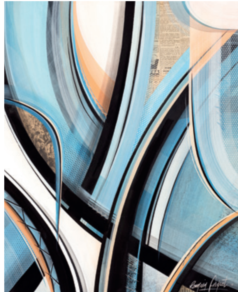
Wild is the wind, Acrylique sur toile, 73x60 cm - 2018 - 1 400,00 €