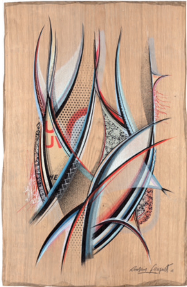
Higher ground , Techniques mixtes sur bois, 33x52 cm - 2018 - 750,00€ monté sur socle