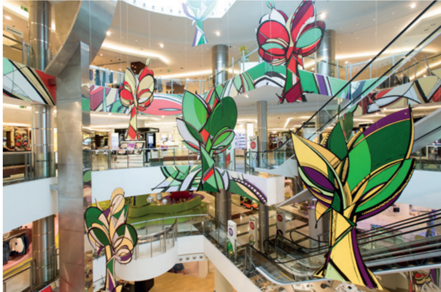
Bosco, Moscou - 2017