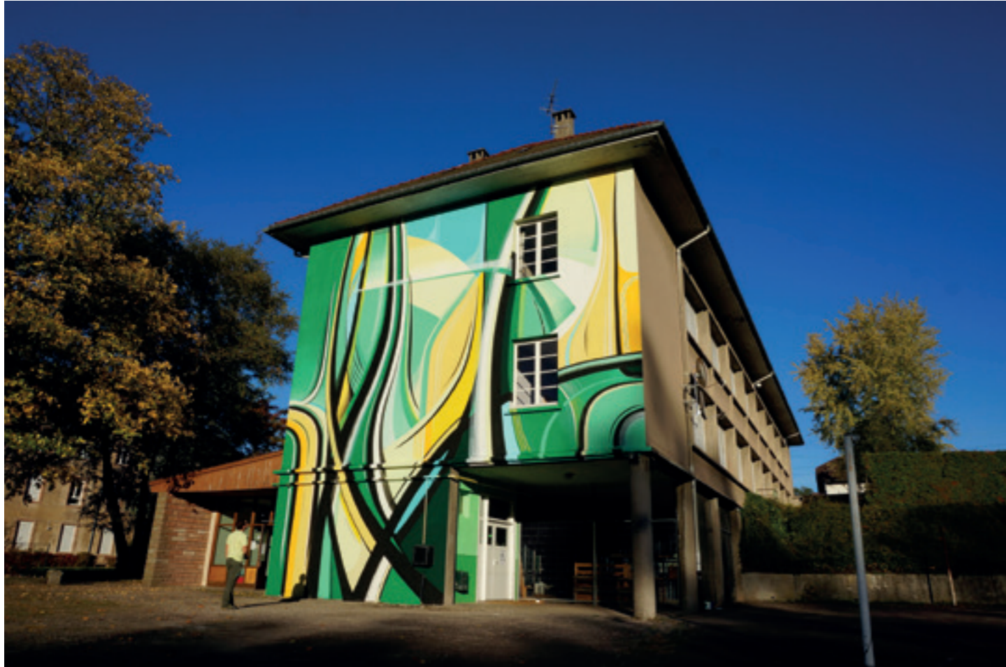
Histoires Urbaines 0.1, Saint Die des Vosges - 2017