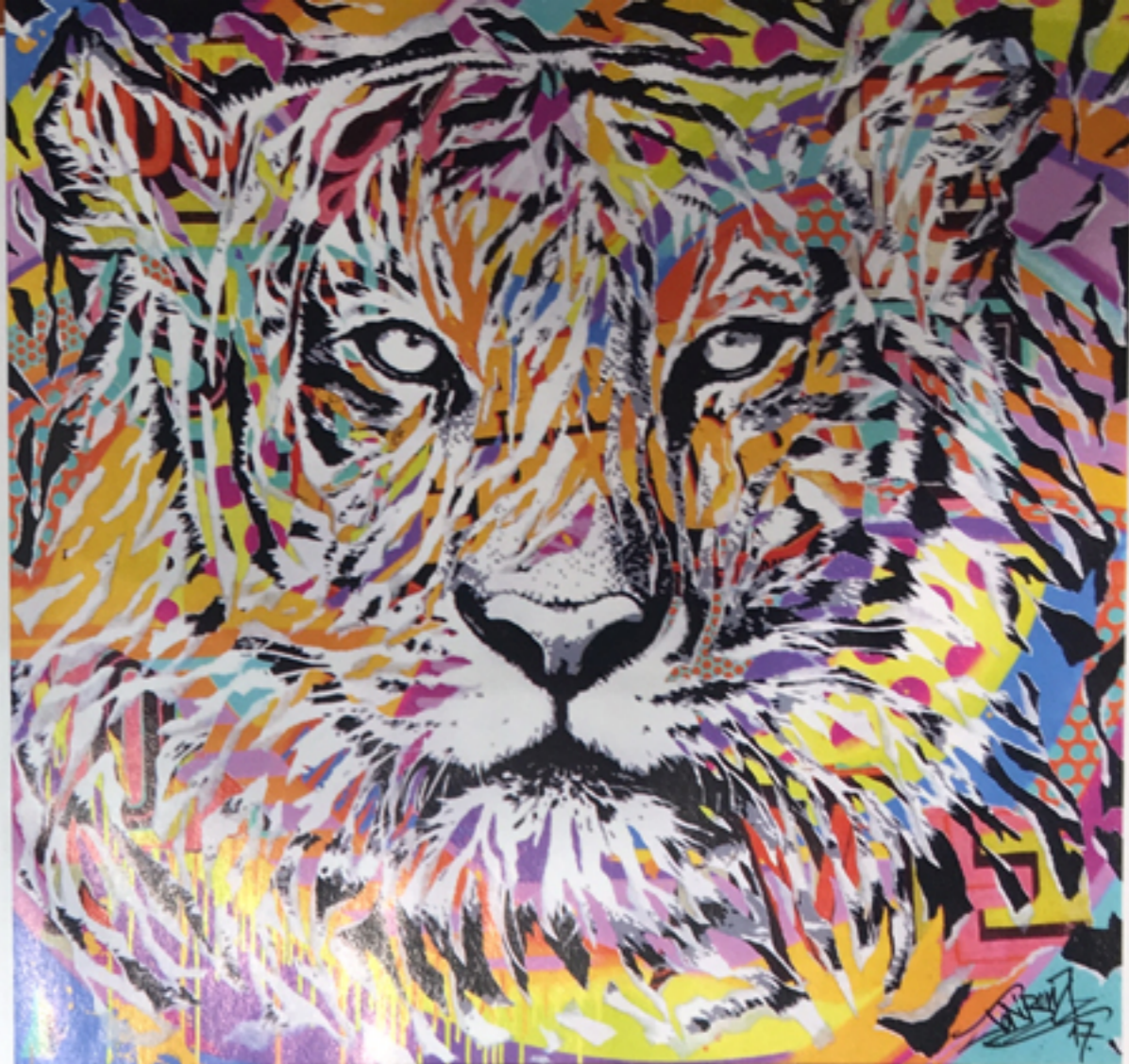
Soul Tiger, 2017, technique mixte sur toile, 100 x 100 cm.