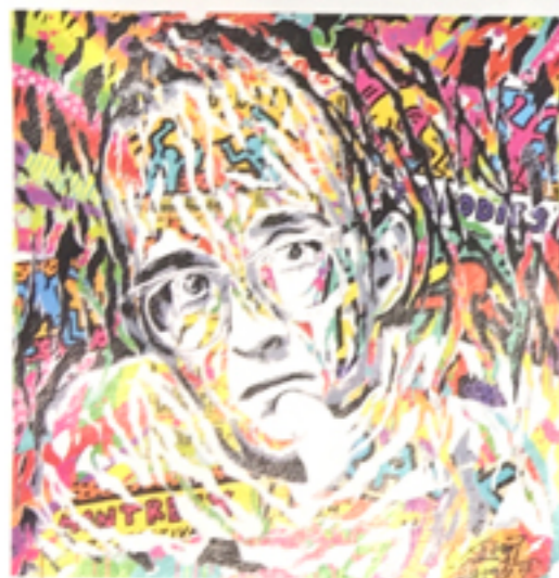
Fucking Rich, 2017, technique mixte sur toile, d'après un cliché de Phila. Inauguration, 100 x 100 cm.