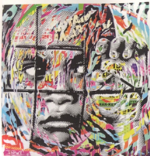
Behind Fences I, 2016, technique mixte sur toile, 100 x 100 cm.