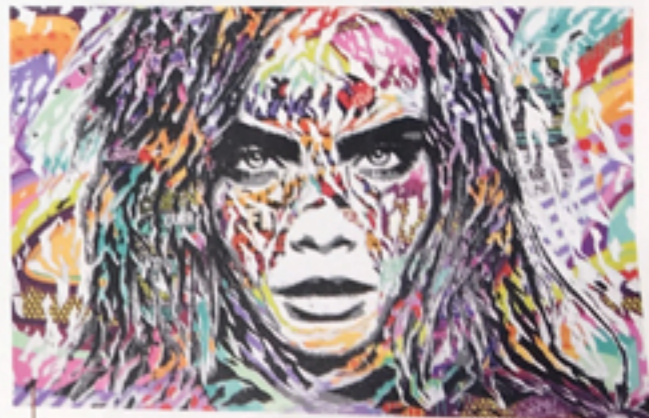
Iconicara, 2017, technique mixte sur toile, 195 x 130 cm.