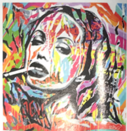
Sex Pistols, 2016, technique mixte sur toile, 100 x 100 cm.

«... j'aime les regards et l'histoire des personnages que je colle». Une technique particulière, fastidieuse qui a fait le style unique de l'artiste. Dans ses œuvres, Jo rend hommage aux icônes et grands personnages de l'histoire, travaille sur des portraits d'anonymes, tout en faisant des clins d'œil à d'autres artistes qui lui sont chers. Fauviste des temps modernes, Jo mélange couleurs et mouvements pour créer des visages empreints de poésie, d'émotions et de joie de vivre. Dans ses œuvres, Jo rend hommage avec la même tendresse aux icônes et grands personnages de l'histoire qu'aux inconnus de passage, nourri par le regard généreux qu'il porte sur l'humain car le plus important à ses yeux, «c'est le partage».