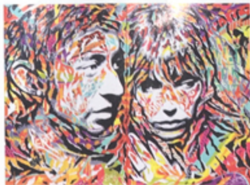
5 bis rue de Verneuil, 2017, diptyque, technique mixte sur toile, 80 x 120 cm.