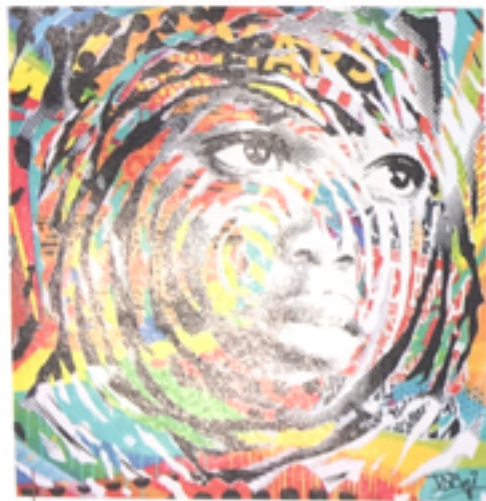
Red and black light, 2016, technique mixte sur toile, 100 x 100 cm.

«La première étape de mon travail est un graffiti traditionnel à l'aérosol. J'utilise parfois des pochoirs à motifs pop pour donner plus de relief. Ensuite, je recouvre le lettrage à l'aérosol avec plusieurs couches de vieilles affiches ou je colle une photo par-dessus. Je déchire ensuite certains endroits pour laisser apparaître le graffiti. J'aime quand la photo est un vecteur d'émotion. ●●●