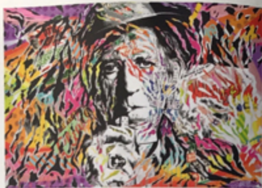
Pop Art Star, 2017, technique mixte sur toile, 195 x 130 cm.