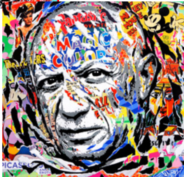
PABLO by JO DI BONA 2019 technique mixte sur toile 100x100