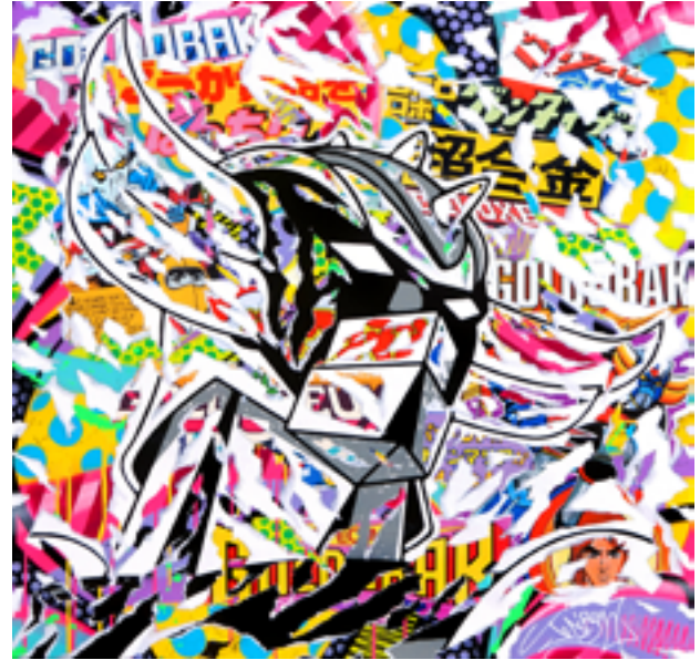
JAPAN ROBOT by JO DI BONA 2019 technique mixte sur toile 100x100