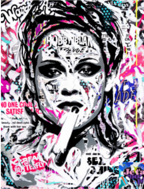
FUCK YOU by JO DI BONA 2019 technique mixte sur toile 97x130