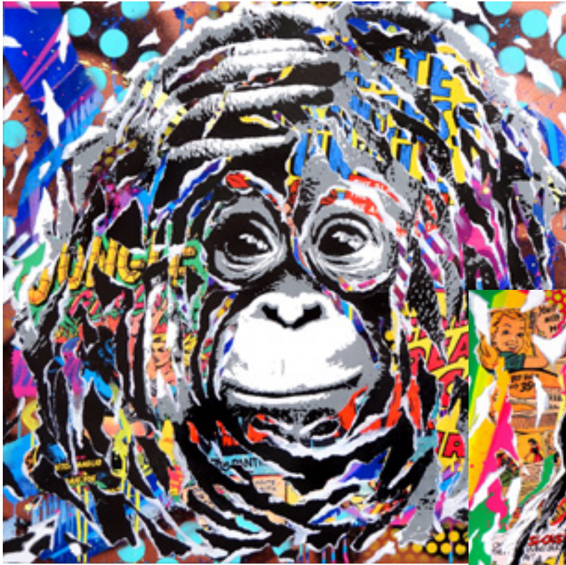
PONGO by JO DI BONA 2019 technique mixte sur toile 80x80