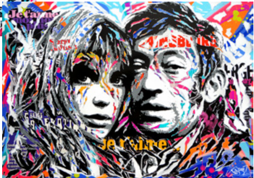
JE T'AIME MOI NON PLUS by JO DI BONA 2019 technique mixte sur toile 120x170