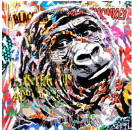
NEW MONKEY by JO DI BONA 2019 technique mixte sur toile 80x80