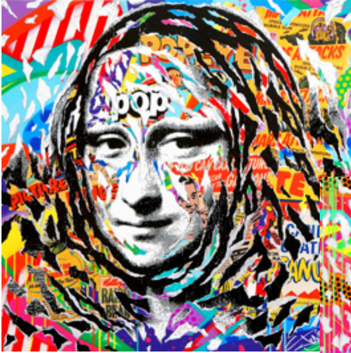
PEANUTS MONA by JO DI BONA 2019 technique mixte sur bois 100x100