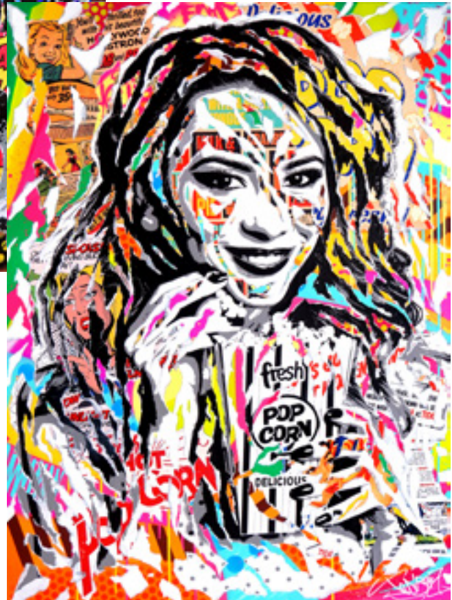
POP CORN 2 by JO DI BONA 2019 technique mixte sur toile 97x130