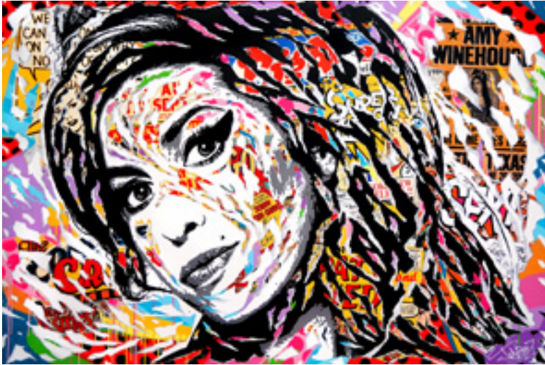
AMY AMY AMY by JO DI BONA 2019 technique mixte sur toile 130x195