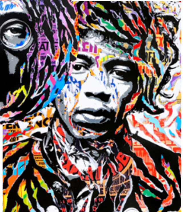
EXPERIENCE by JO DI BONA 2019 technique mixte sur toile 120x140