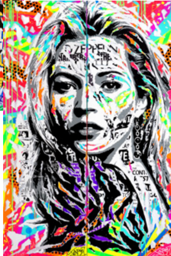
PHOSPHO KATE by JO DI BONA 2019 technique mixte sur toile diptyque 50x150 + 50x150