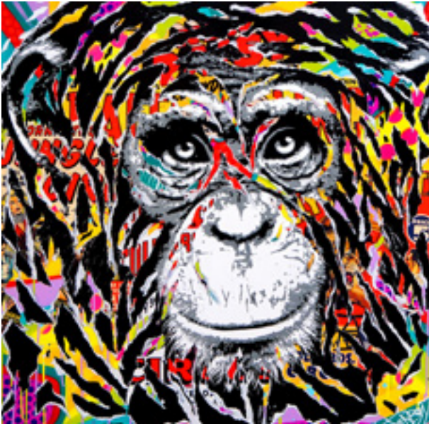
CHIMPANZEE by JO DI BONA 2019 technique mixte sur toile 100x100