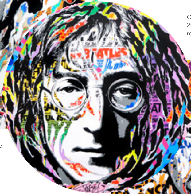
CIRCLE JOHN by JO DI BONA 2019 technique mixte sur toile ronde diamètre 100