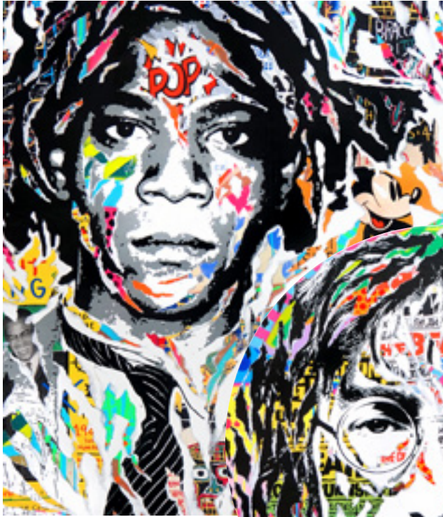
DO THE RIGHT THING by JO DI BONA 2019 technique mixte sur toile 120x140