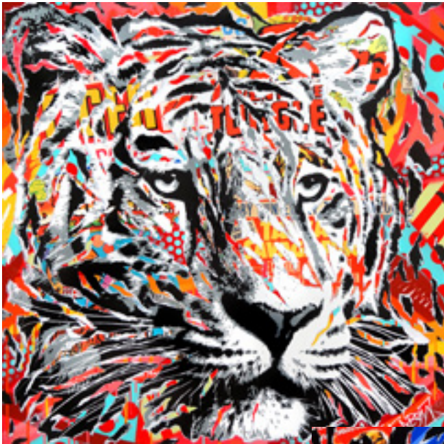
JUNGLE FEVER by JO DI BONA 2019 technique mixte sur toile 100x100