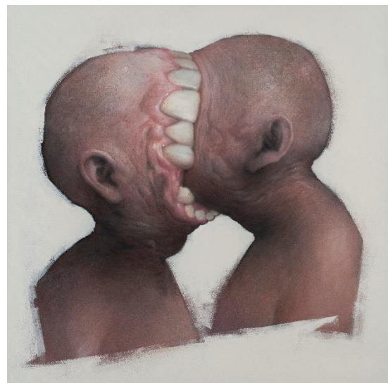
Bom.K ego 70x70cm tech mixte sur toile 2020 © Jean-Louis Losi

Pour rendre hommage à l'œuvre prolifique de cet artiste de référence sur la scène de l'art urbain française des années 2000, le galeriste Joël Knafo propose A FLEUR DE CHAIR. Cette superbe monographie, entièrement dédiée à l'œuvre de Bom.K, retrace par la photographie l'ensemble de son parcours artistique. Capturées par l'artiste lui-même ou par le photographe Nicolas Gzeley (entre autres), ce sont ainsi des centaines d'œuvres qui se dévoilent : graffitis, fresques monumentales, dessins sur toiles et tant d'autres montrant toute l'amplitude du talent de celui qui voilà une trentaine d'années arpenteait la ligne du RER D, bombe de peinture en main.