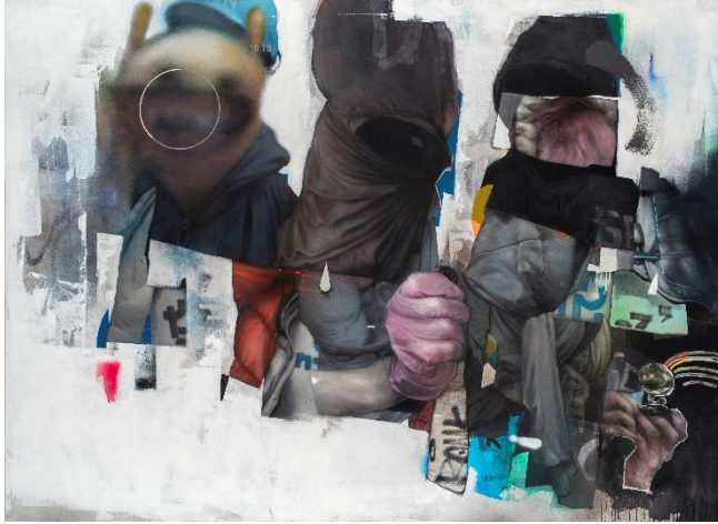
Bom.K Urban Kontortion 220x160cm tech mixte sur toile 2020

Influencé par les artistes graffeurs new-yorkais, Bom.K trace ses premiers tags à 17 ans sur les murs et les trains de son quartier de Vigneux-sur-Seine. Une dizaine d'années plus tard, en 1999, il fonde avec Iso et Kan le collectif « Da Mental Vaporz » (DMV), où chacun de membres peut développer les spécificités de son style. Dans ce cadre, Bom.K commence à produire un graffiti plus personnel et intimiste : B-Boys décharnés à la mine patibulaire, chambres d'isolement capitonnées ou encore barres de béton cauchemardesque.