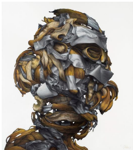
Bom.K Scotch Banana 170x150cm tech mixte sur toile 2020

L'artiste articule autour d'un réalisme inquiétant les notions de vie et de mort, façonnant un univers plus vrai que nature avec une extraordinaire dextérité. Montrant une prédilection certaine pour le corps humain et l'organique, Bom.K travaille l'anatomie, la dessine, la modèle avec une extrême finesse et une rigueur scientifique. La chair se tord, s'écrase et s'étire, comme pétrie par un miroir déformant où il convient à chacun de déceler la beauté dans ce qu'il contemple.